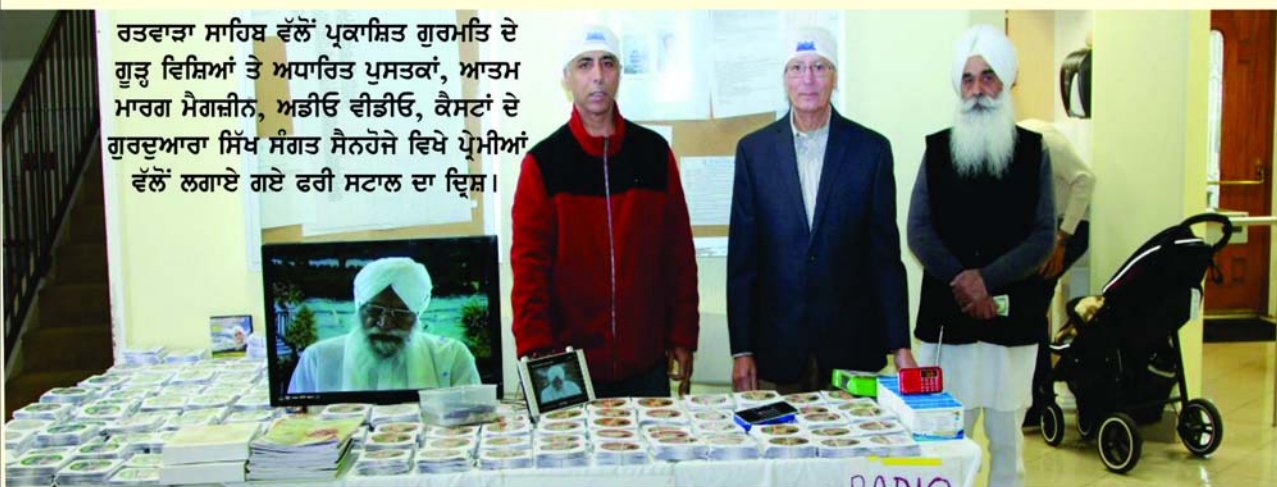
ਰਤਵਾੜਾ ਸਾਹਿਬ ਵੱਲੋਂ ਪ੍ਰਕਾਸ਼ਿਤ ਗੁਰਮਤਿ ਦੇ ਗੂੜ੍ਹ ਵਿਸ਼ਿਆਂ ਤੇ ਅਧਾਰਿਤ ਪੁਸਤਕਾਂ, ਆਤਮ ਮਾਰਗ ਮੈਗਜ਼ੀਨ, ਅਡੀਓ ਵੀਡੀਓ, ਕੈਸਟਾਂ ਦੇ ਗੁਰਦੁਆਰਾ ਸਿੱਖ ਸੰਗਤ ਸੈਨਹੋਜੇ ਵਿਖੇ ਪ੍ਰੇਮੀਆਂ ਵੱਲੋਂ ਲਗਾਏ ਗਏ ਫਰੀ ਸਟਾਲ ਦਾ ਦ੍ਰਿਸ਼।